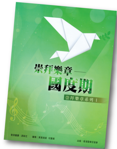
崇拜樂章系列 I SML001 《國度期》