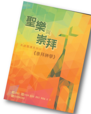
聖樂與崇拜系統閱讀系列 II CM002 《崇拜神學》