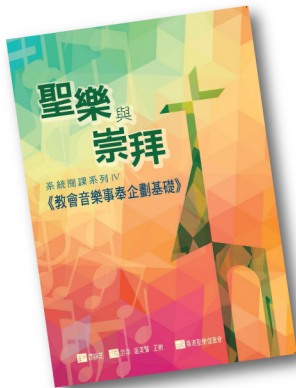
聖樂與崇拜系統閱讀系列 IV CM004 《教會音樂事奉企劃基礎》