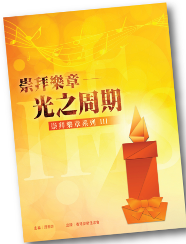
崇拜樂章系列 III SML003 《光之周期》