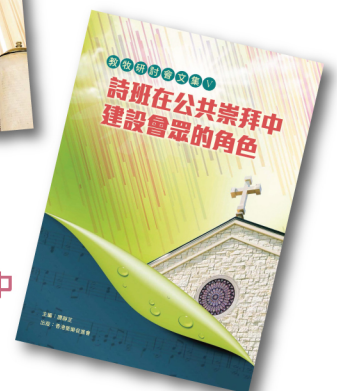
教牧研討會文集 V PCS005 《詩班在公共崇拜中建設會眾的角色》