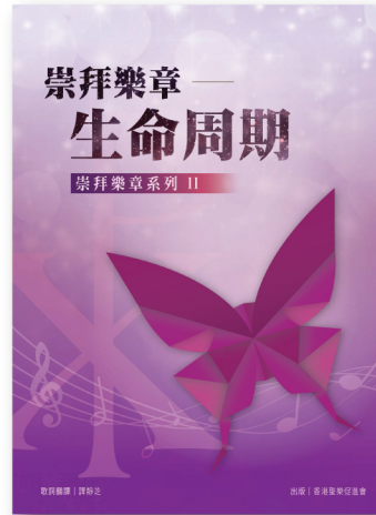
崇拜樂章系列 II SML002 《生命周期》