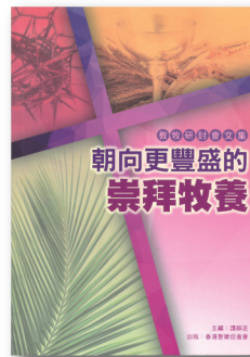
教牧研討會文集 I PCS001 《朝向更豐盛的崇拜牧養》