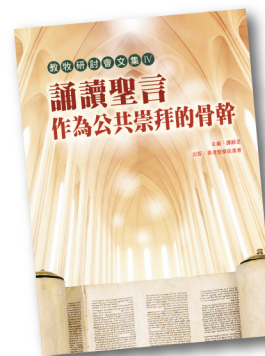
教牧研討會文集 IV PCS004 《誦讀聖言作為——公共崇拜的骨幹》