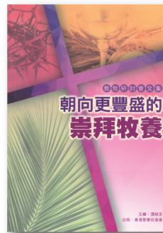
教牧研討會文集 I PCS001 《朝向更豐盛的崇拜牧養》